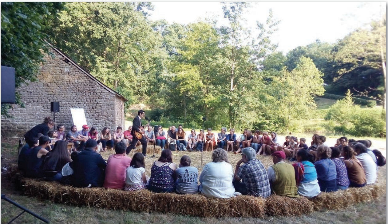
Création éphémère aux Entrelacés, Lassy-les-châteaux, juillet 2019

La sortie de création sera prévue pour le printemps 2022.