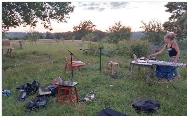
En résidence à Uzerche chez Lost in Tradition (les San Salvador), juillet 2020.