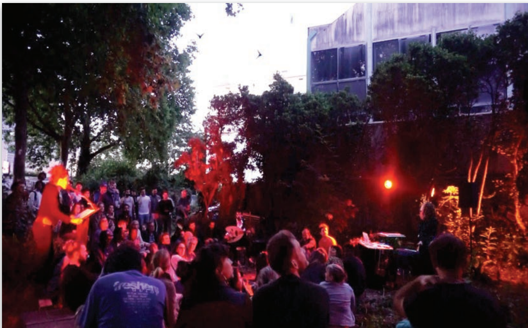
Sortie de résidence à Nantes, aux ateliers Magellan dans le cadre de la saison déconfinée, mai 2020

Si l'univers perçu et vécu par les chauves-souris nous est radicalement inaccessible, nous pouvons mentalement nous y projeter en faisant appel à l'intersubjectivité entre nos mondes. Nous souhaitons que cette démarche mentale, fortement facilitée, accélérée et partagée en groupe grâce aux images et aux actions vécues dans le spectacle vivant, puisse constituer un chemin vers des acceptations inter-humains et inter-spécistes.