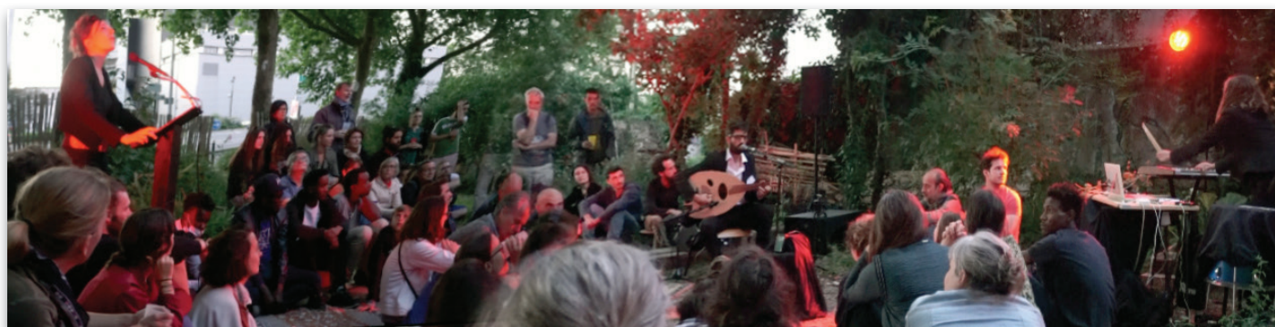
Sortie de résidence à Nantes, aux ateliers Magellan dans le cadre de la saison déconfinée, mai 2020

Toutefois des découvertes récentes montrent que certaines espèces, peut être toutes, utilisent les ultrasons pour chanter, les chauves-souris étant des animaux sociaux. Il est donc possible d'imaginer que ces chants soient, au même titre que les oiseaux, captés et que nous puissions y répondre, c'est l'objet du spectacle qui emprunte alors les codes de l'expérience scientifique participative.